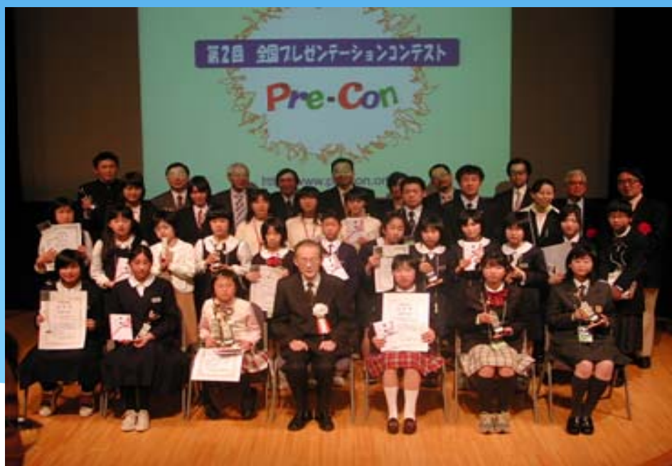
<記念撮影> 全国大会出場チームの皆さんと審査委員、実行委員