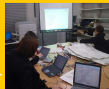
GISへのデータ入力 HP作成、サーバーへUP、公開へ